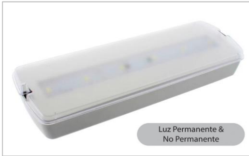
Luz Permanente & No Permanente